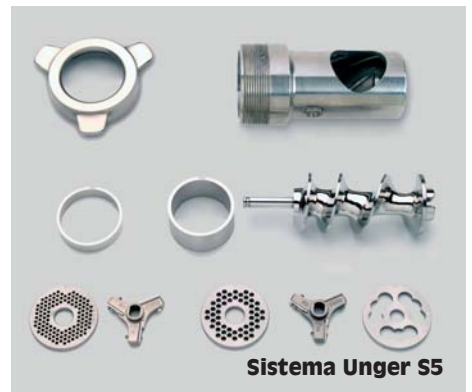
Sistema Unger S5