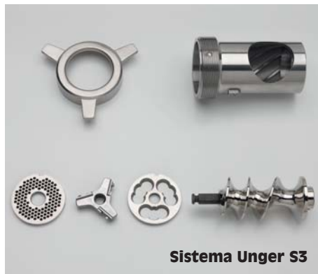
Sistema Unger S3